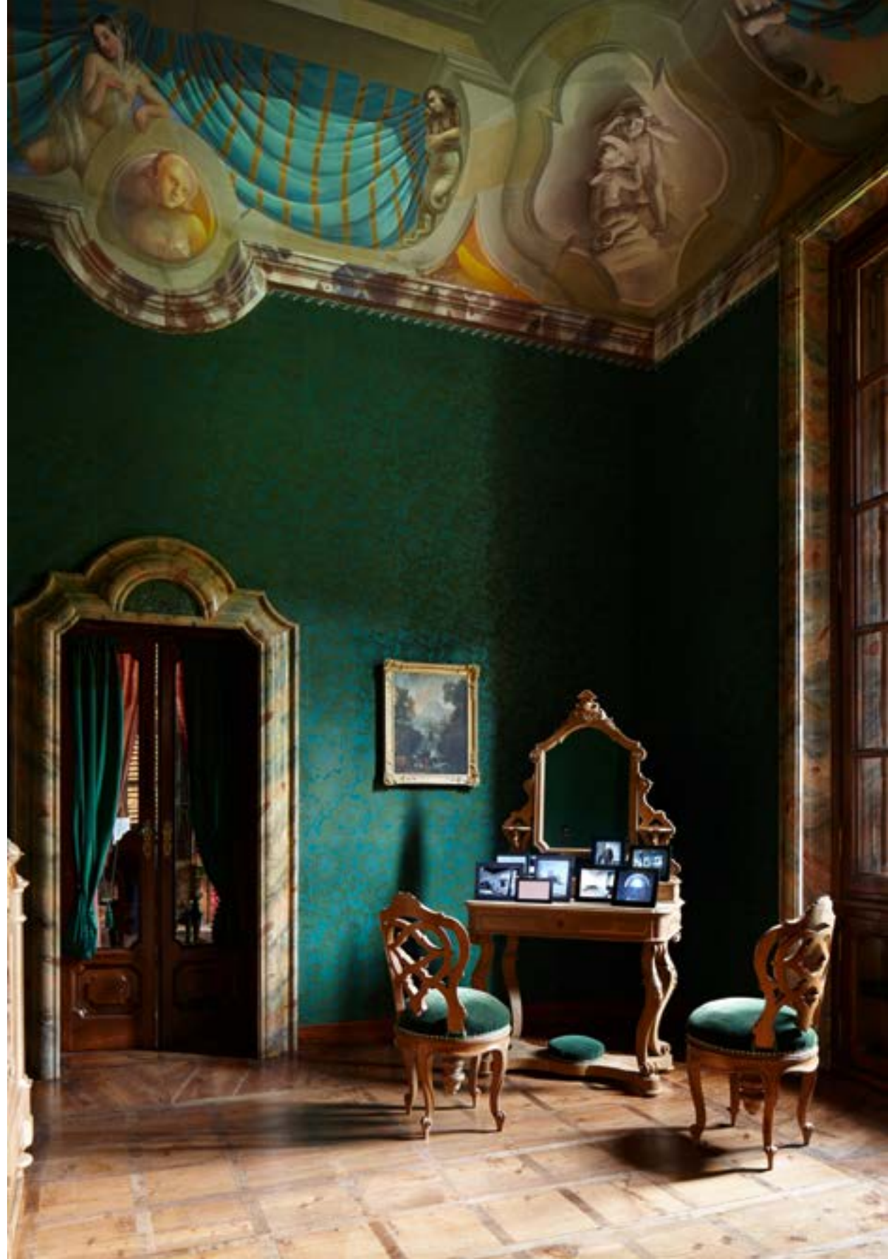
«Ich sehe (was war)», 2013 · cornici digitali (jpg e wav), sequenza più lunga: 12' 30'' © 2013, ProLitteris, Zurich

L'intervento riesce ad ammalciare l'osservatore attirandolo nella bolla temporale descritta all'inizio. L'intimità venutasi a creare nei racconti e la loro traduzione è il risultato di un avvicinamento sensibilissimo e di approfondite ricerche fatte dall'artista. Céline Gaillard