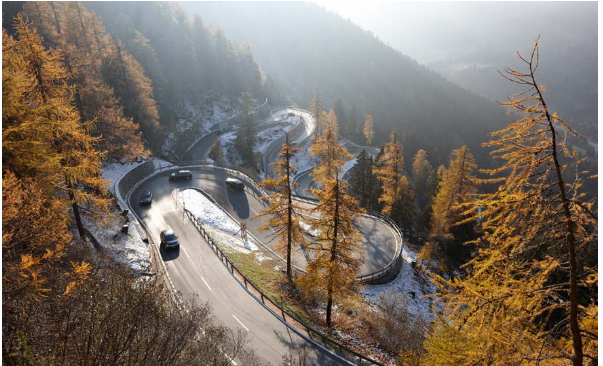
Passo del Maloja